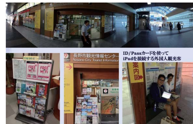
JR長野駅観光案内所でもWi-Fi告知

付記: 表参道の夜景を明るくしようと、10月よりNUPRI事務所の夜間照明を点灯しています。(22時まで)