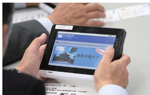
参加者はタブレット端末でWi-Fi操作を試みた

が丘の場合—NTT東日本が幹事となり、自由が丘商店街(振興組合)=店舗への光ステーション導入、東急電鉄グループ=各駅への公衆無線LAN敷設、大日本印刷=商店街サイトの運営・紙媒体ガイドの電子化、その他の企業(広告代理店など)が協業し、「自由が丘ならではの」情報を常に発信しています。喜多方では、喜多方老麺会と喜多方市の協力でスタンプラリーの実施、イベント会場と市内ラーメン店・土産店・観光施設を繋ぎ、創客・誘客の実現を図っています。県内では安曇野商工会堀金支部IT委員会が観光客の増加を狙って安曇野地域限定、無線LANを始めました。