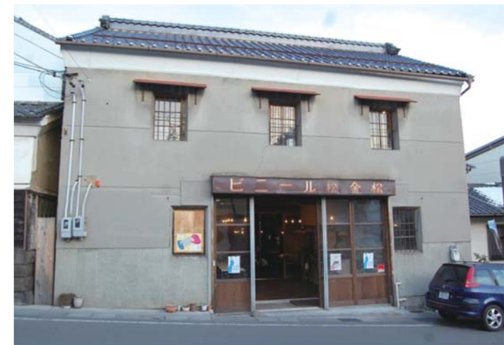
善光寺門前リノベーションの一例「ボンクラ」。単に使われなくなった蔵の再生以上の意味がある