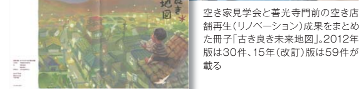
空き家見学会と善光寺門前の空き店舗再生(リノベーション)成果をまとめた冊子「古き良き未来地図」。2012年版は30件、15年(改訂)版は59件が載る