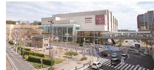
劇場が発するエネルギーが人を呼び込み、今では西宮北口は関西の住みたい街No.1に

京都弁の穏やかな語り口から、長野市芸術館を盛り上げる斬新な策が次々と打ち出され、その柔軟な発想に思わず感嘆の声が上がるシーンも多数。芸術館の今後がますます楽しみになった内容充実の講演でした。