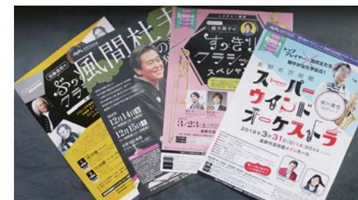
長野市芸術館では、親しみやすい催しも幅広く展開