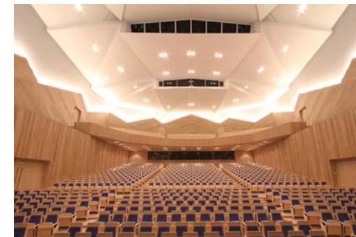
長野市芸術館 メインホール